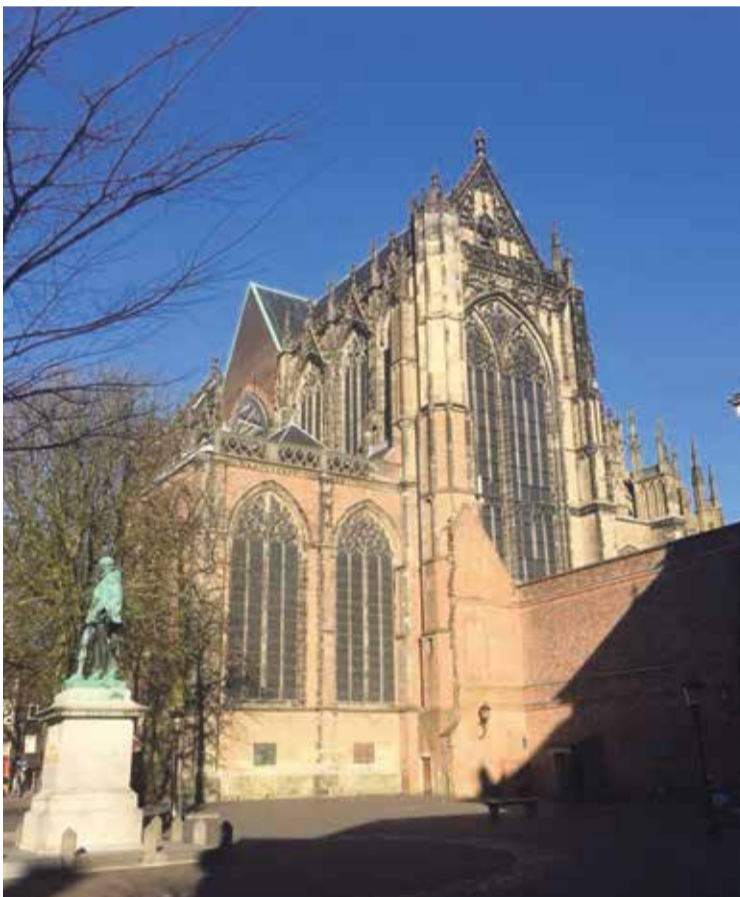
* Gevel van de Domkerk, gezien vanuit het zuidwesten.

van het met steun van alle partijen gevormde Kapitaal Groot Onderhoud (KGO) aanzienlijk gedaald. Dit betekent dat de kerk in aanvulling op de verkregen subsidies voor restauratie en groot onderhoud, de renteopbrengst uit het KGO en de jaarlijkse dotatie van het Citypastoraat Domkerk voor onderhoud van € 50.000 per jaar, een groot bedrag aan eigen middelen voor de aanvul-